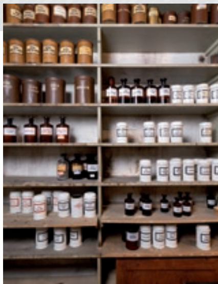
Vue prise par le photographe Pierre Montavon dans les anciens dépôts de la Pharmacie Riat à Delémont, avant que les locaux ne soient vidés.

136 ouvrages, ainsi que 28 revues ont été enregistrés dans la bibliothèque du musée.