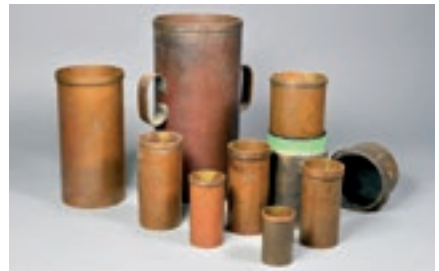
Huit mesures de liquide d'une capacité de 1dl à 5l.