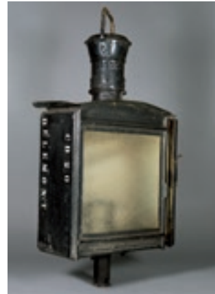
Lanterne de la gare de Delémont.