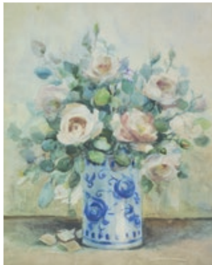
« Nature morte », aquarelle de Claire Weber, 1917