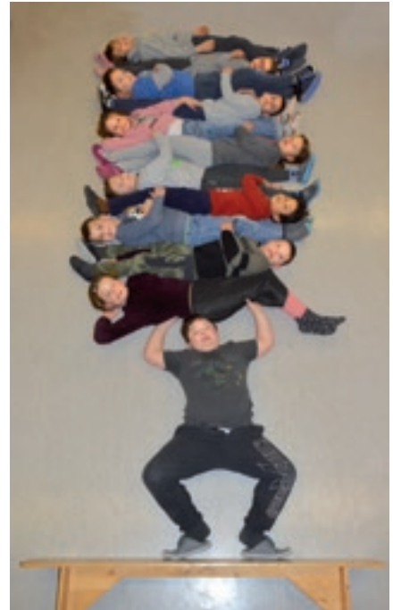
Une photo « classe » / création de la classe de 3 e et 4 e HarmoS, école primaire de Miécourt.

Un cycle de conférences sur cinq soirées a été mis sur pied, des ateliers ont été conçus et proposés aux écoles et au jeune public, plusieurs visites accompagnées ont été assurées par les membres de Mémoire de l'école jurassienne.