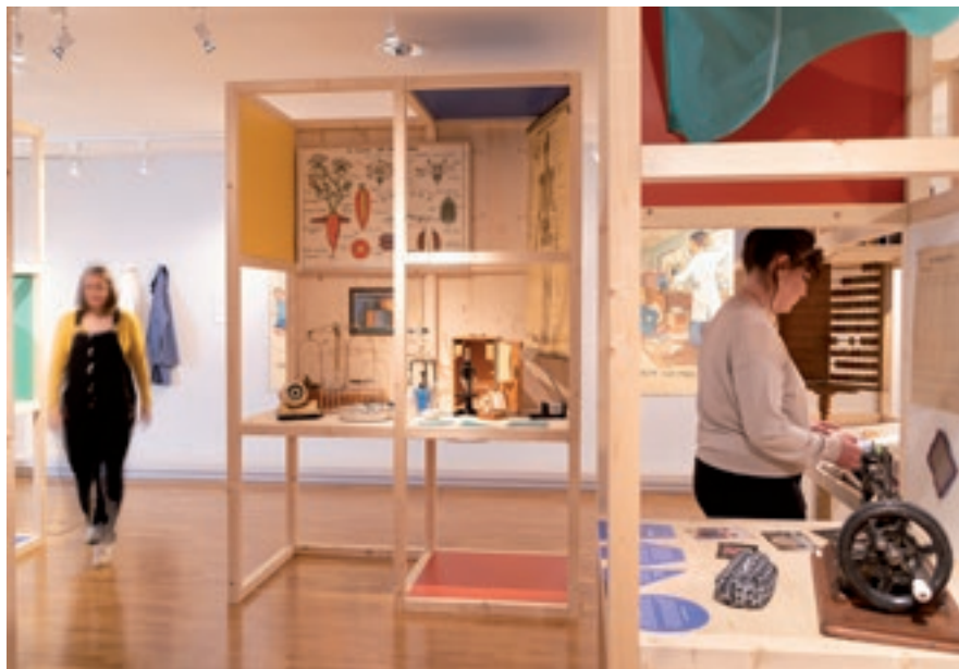
Vue de l'exposition consacrée à l'école.

L'exposition Le Grand Atlas des yeux baissés , par Alan Humeroise, a fermé ses portes le 27 février 2022. Dernier volet d'une trilogie composée de L'Herbier Humeroise et du Vertige des Réserves , l'exposition était accompagnée d'un ouvrage éponyme paru en février 2022 aux éditions Infolio. Les 208 pages de ce livre sont richement illustrées.