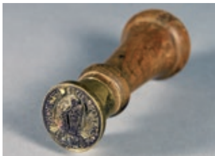
Sceau Canton de Delémont – MT [dép. du Mont-Terrible], 1793-1800.