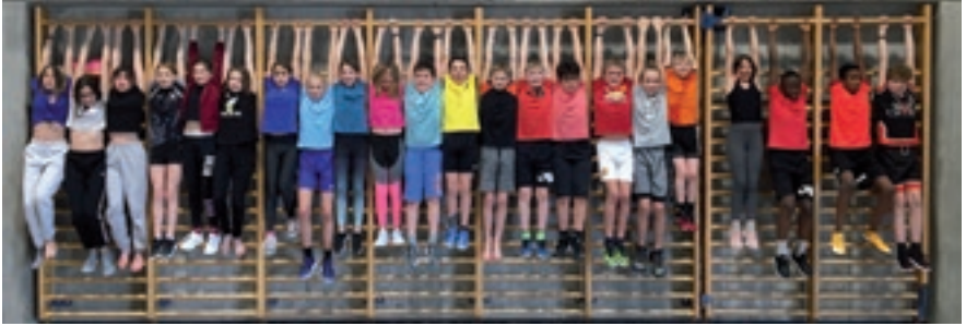
Une photo « classe » / création de la classe 8 e HarmoS, école primaire du Château de Delémont.

Trois projets collaboratifs ont été mis sur pied dans le cadre de cette exposition :