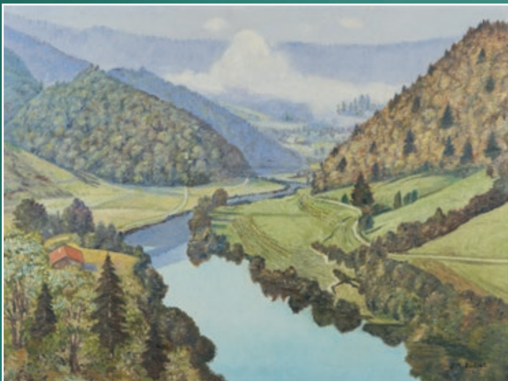
Le Doubs, huile de Jules-Arnold Boillat, s.d.