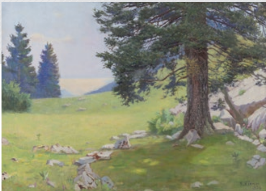
Chasseral, huile de Robert Kiener, 1936