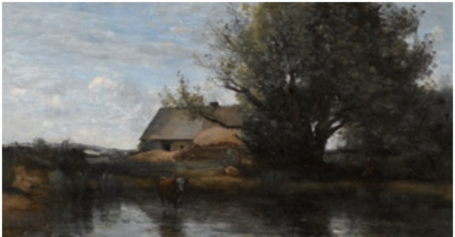
Ferme avec étang , huile sur toile de Camille Corot, 1855-1858.