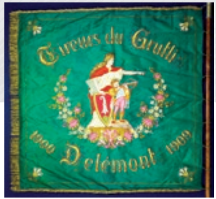
Tir du Grütli Delémont, vues des deux faces du drapeau, 1909.