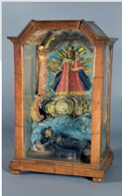
« Vierge à l'Enfant et saint Ursanne », vitrine religieuse.