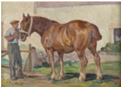
Le Cheval , huile de François Louis Jaques, 1932