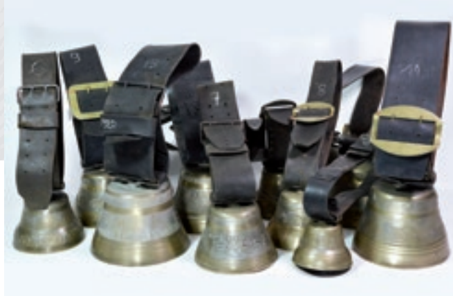
Collection de cloches de vache fabriquées à Delémont, A. Taddeoli ou Vittone & Cie, 1920, 1923, 1929 et s.d.