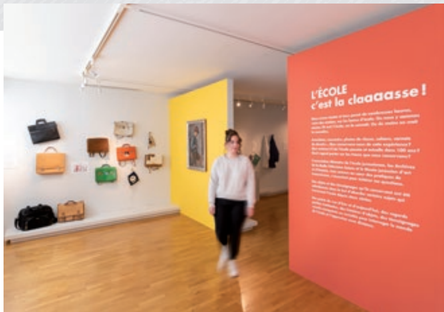
Vue de l'exposition consacrée à l'école.