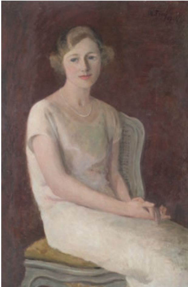
Jeune femme assise, huile sur toile de Marguerite Frey-Surbek, 1924.