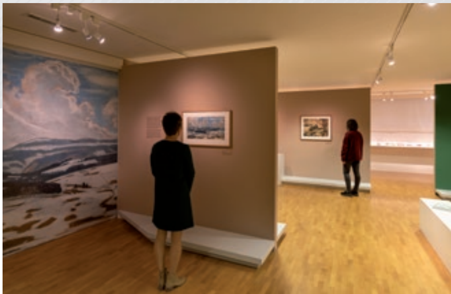
Vues de l'exposition Charles L'Eplattenier. Pastels du Doubs .