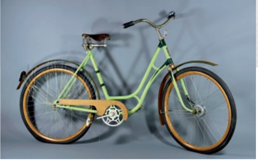
Vélo Jurassia Bassecourt.